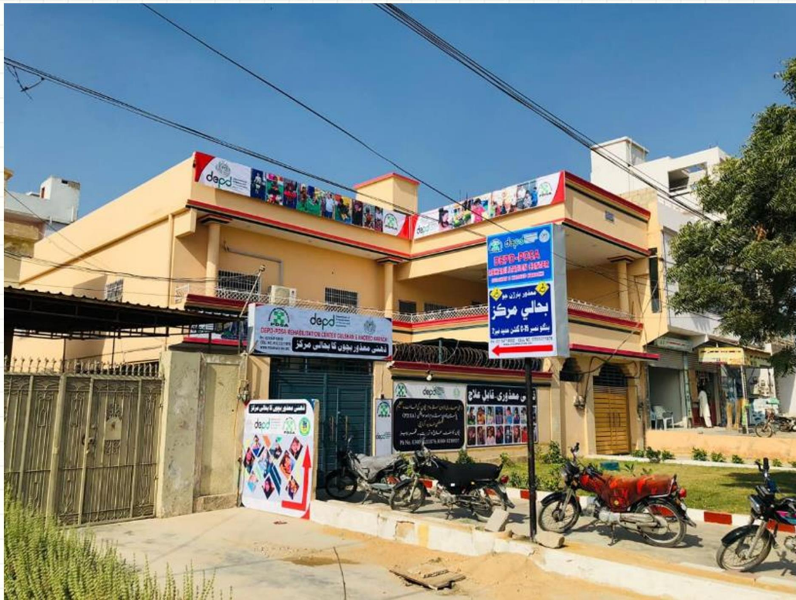
NEW UNIT OF DEPDP-PDSA REHABILITATION CENTER, GULSHAN E HADEED, KARACHI