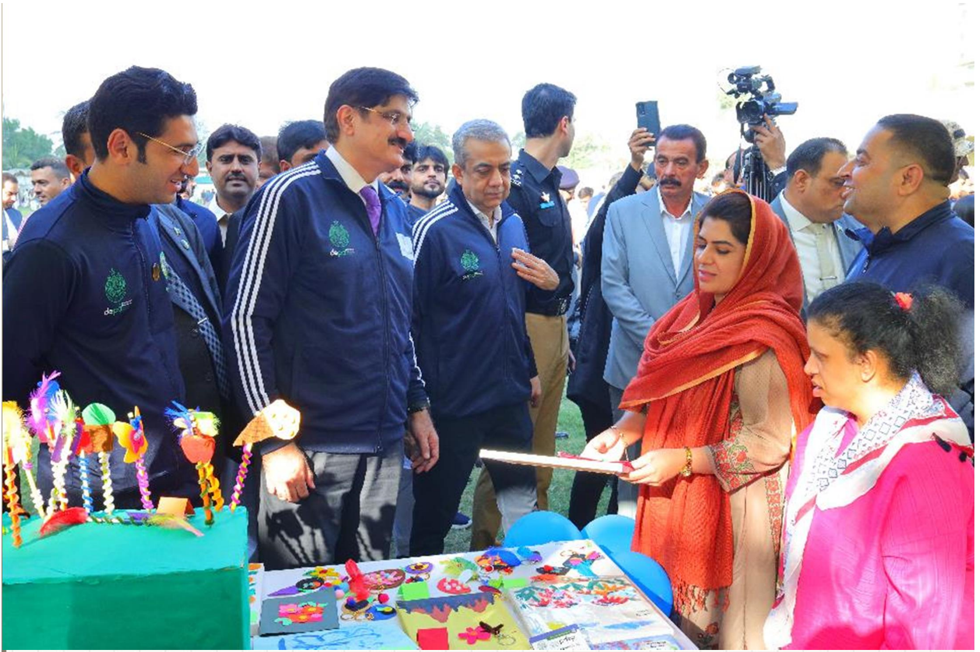
CM SINDH SYED MURAD ALI SHAH AT STALL OF PDSA PAKISTAN