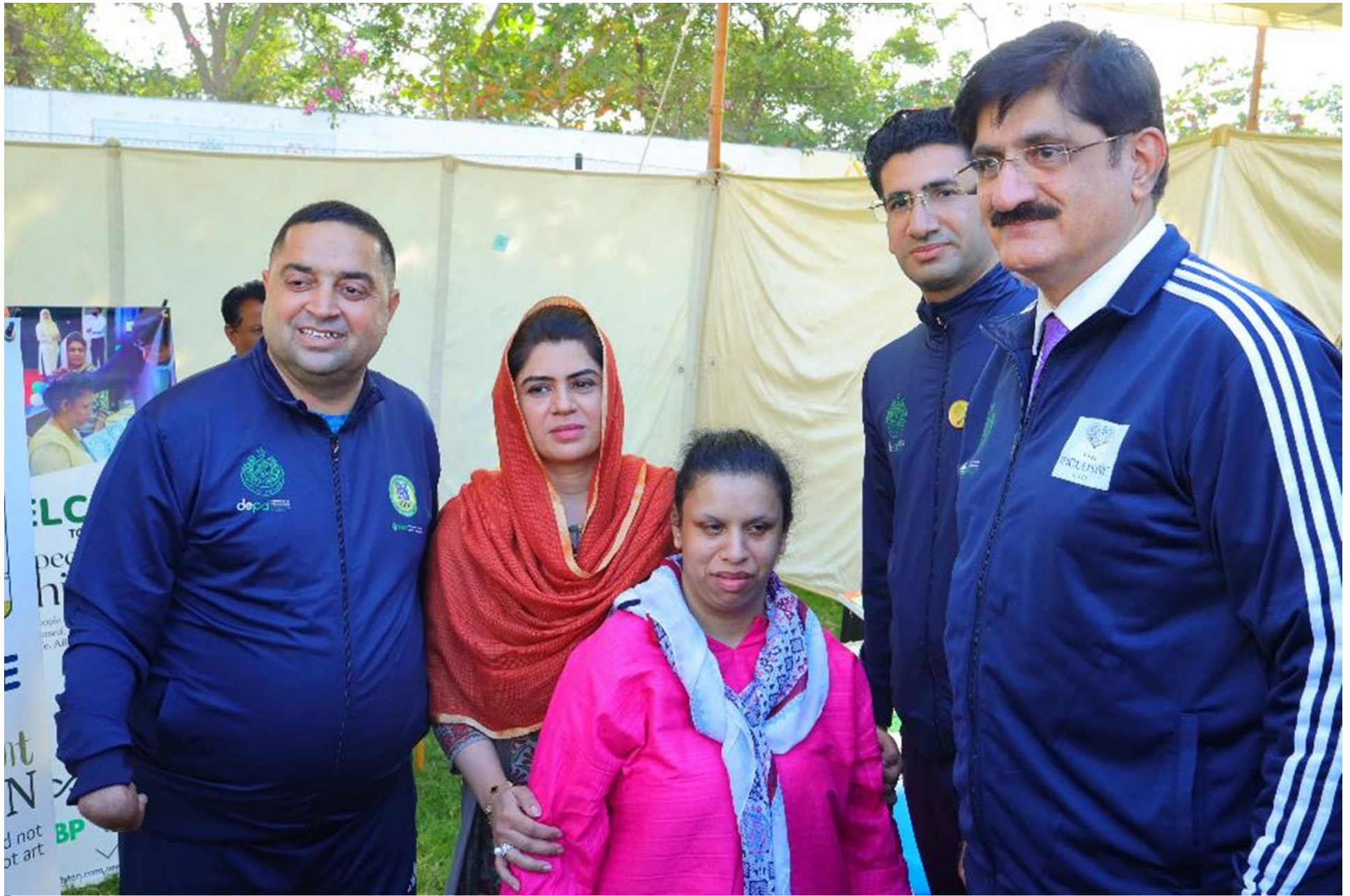
CM SINDH SYED MURAD ALI SHAH AT STALL OF PDSA PAKISTAN